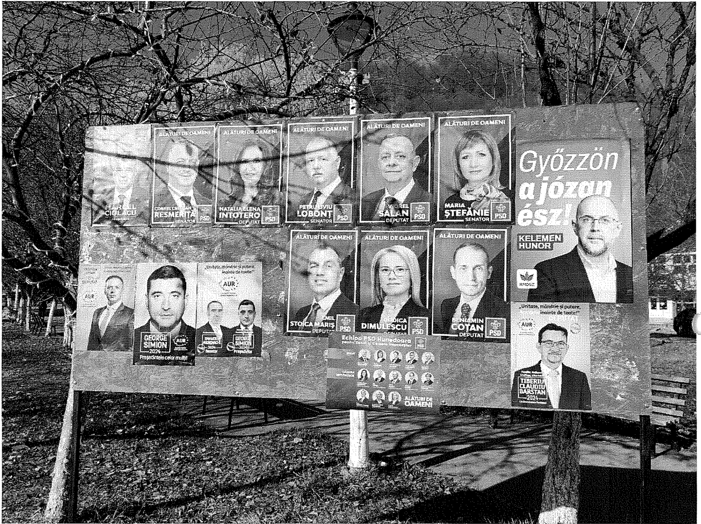
WhatsApp Image 2024-11-05 at 12.42.50.jpeg