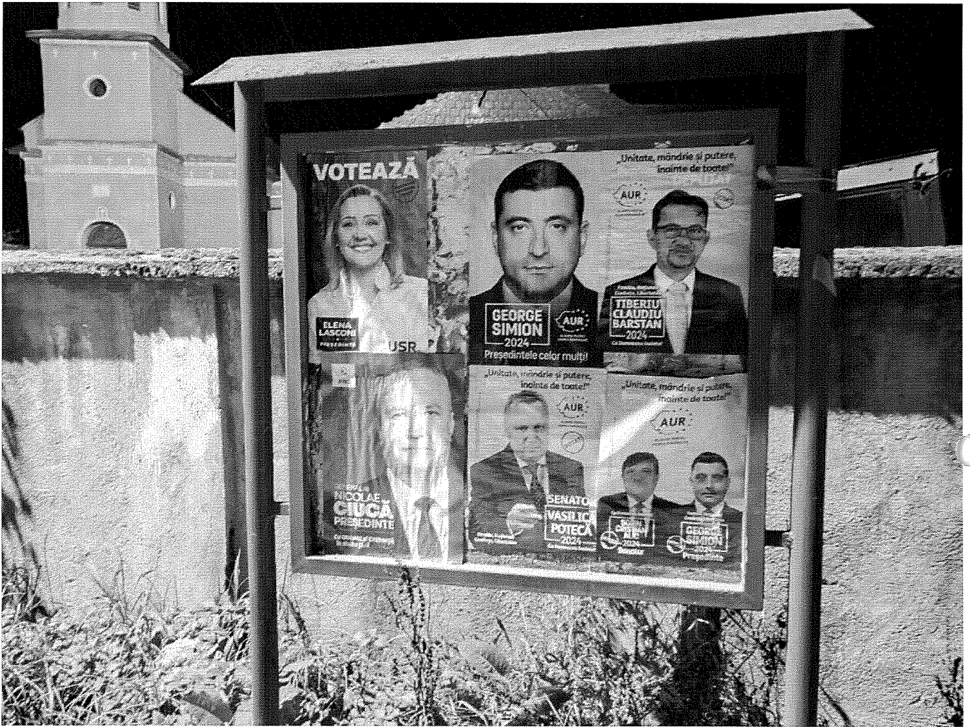
—WhatsApp Image 2024-11-03 at 21.53.22.jpeg