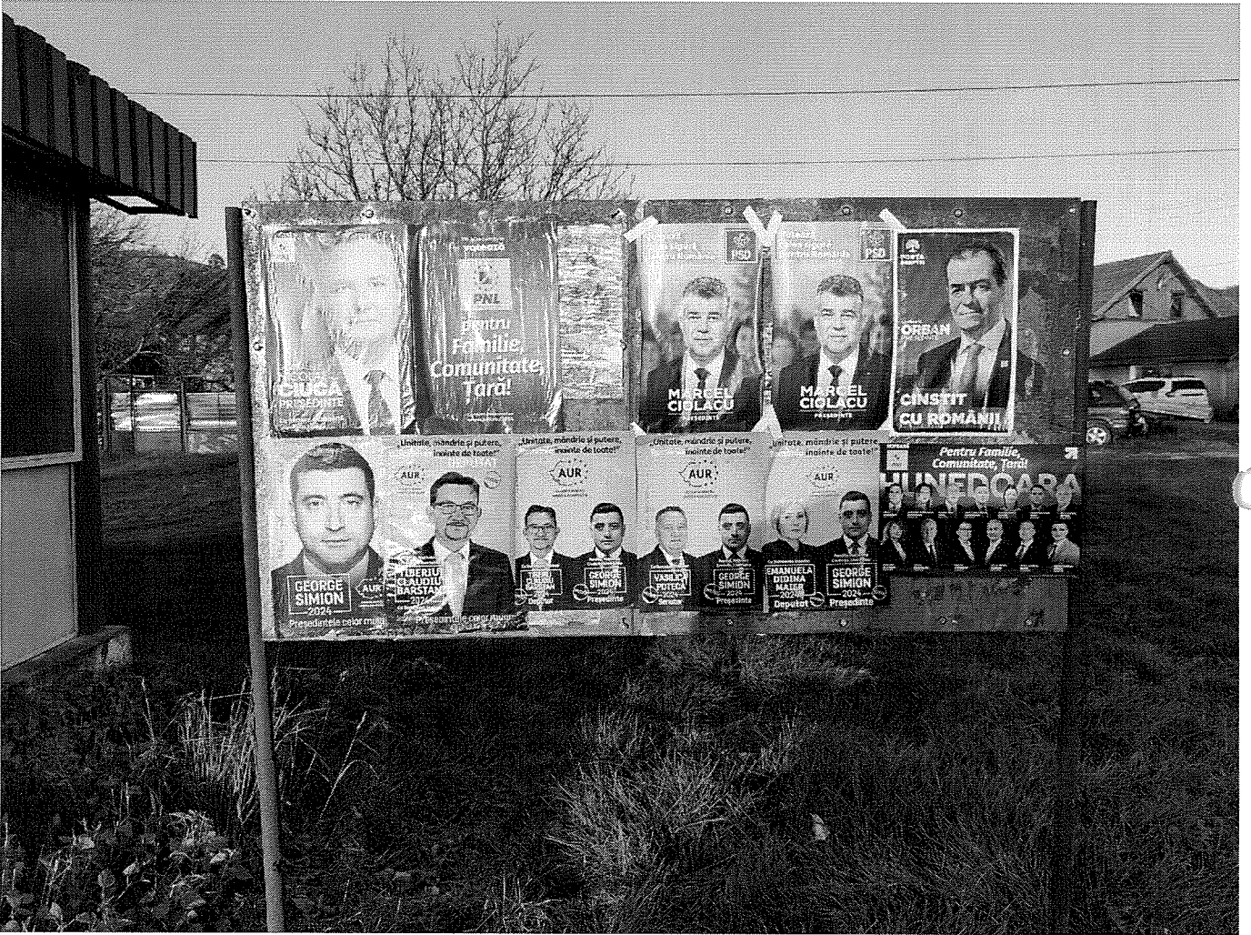
—WhatsApp Image 2024-11-05 at 13.18.10.jpeg