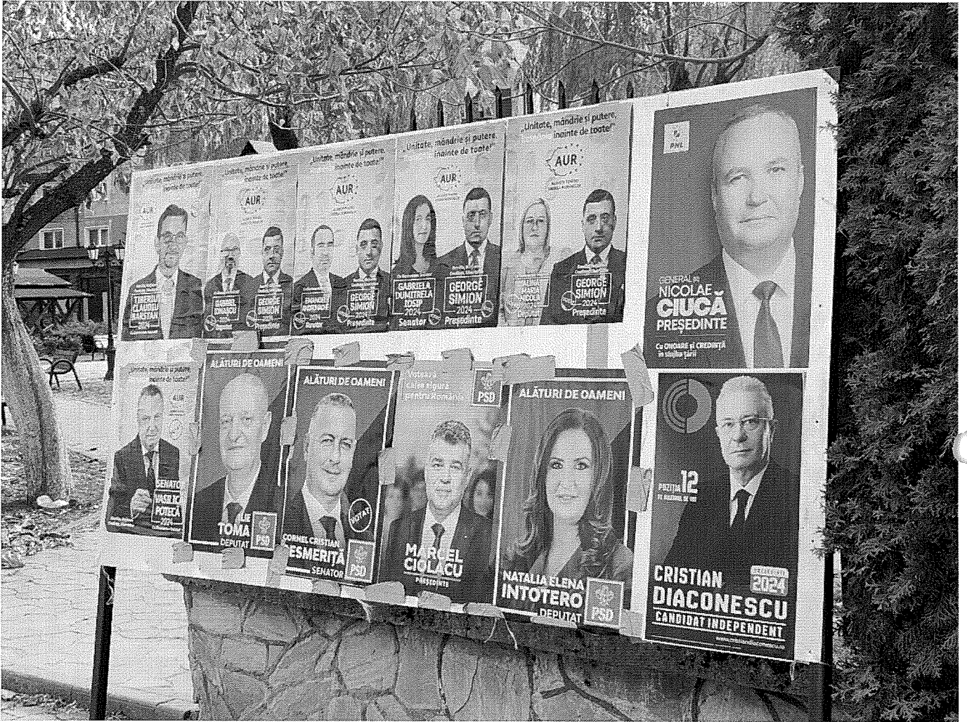
—WhatsApp Image 2024-11-03 at 22.32.34.jpeg