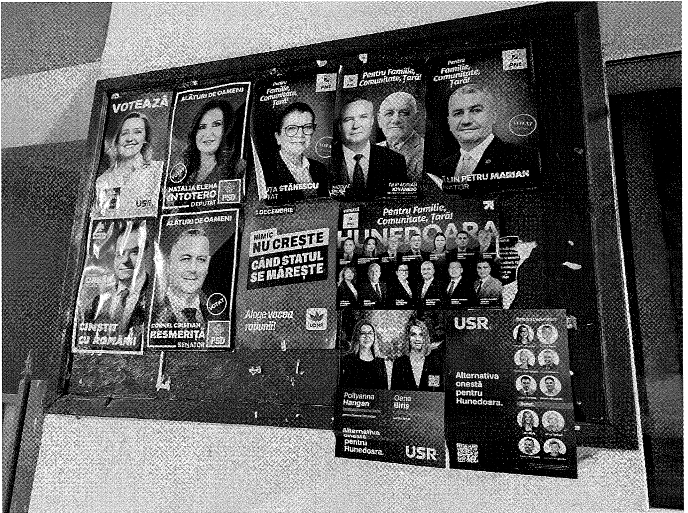
WhatsApp Image 2024-11-03 at 22.22.51.jpeg