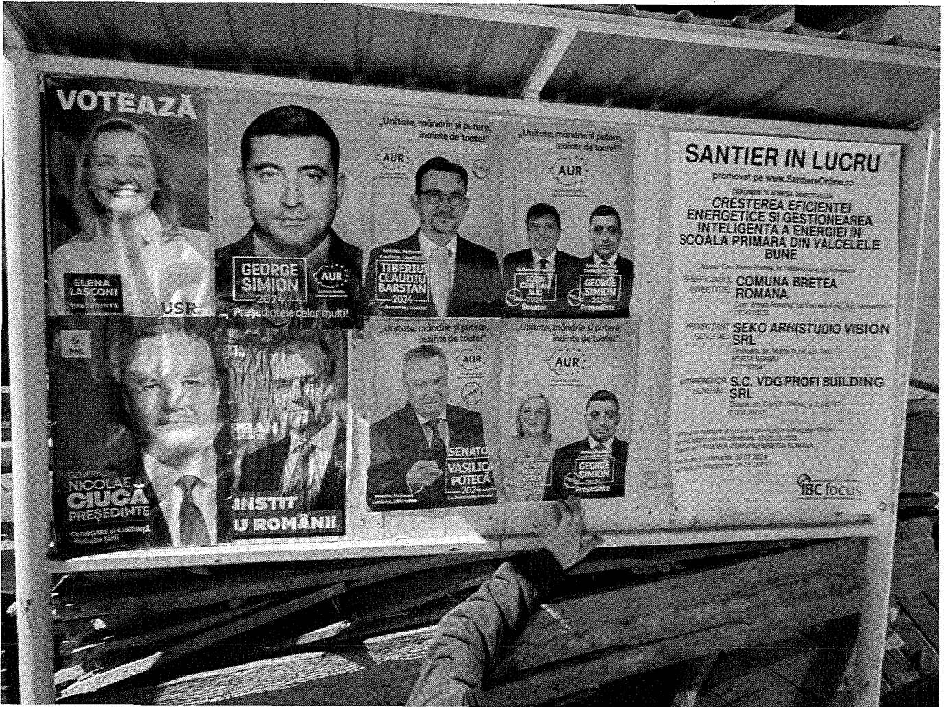
WhatsApp Image 2024-11-03 at 21.30.42.jpeg