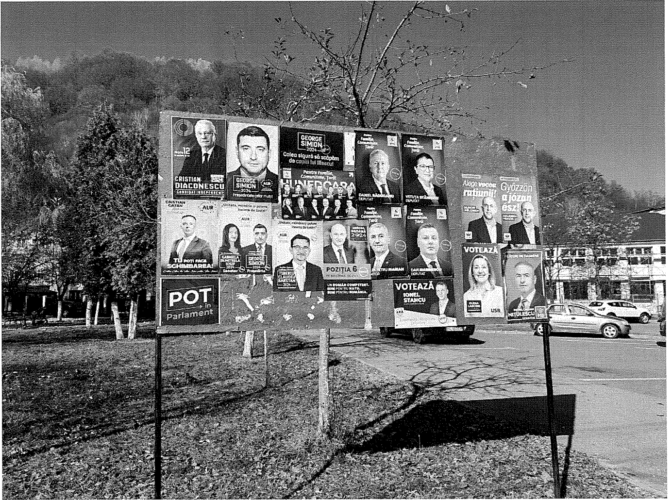
—WhatsApp Image 2024-11-05 at 12.08.17.jpeg—